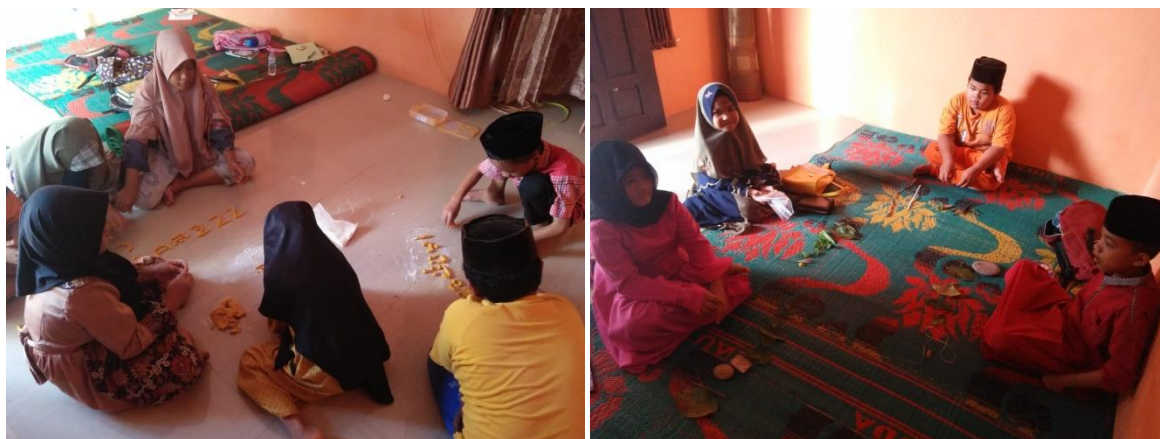
Gambar 1. Kegiatan Belajar Shift Pertama dan Shift Kedua Kelas Zamzami TK Balita Quran

Kutipan wawancara di atas mengkonfirmasi bahwa peralihan pembelajaran menjadi pola bergilir ( shift-shiftan ) merupakan kesepakatan bersama pihak TK atas perubahan kondisi sesuai anjuran social distancing . Berikut ditampilkan gambar anak belajar dalam shift pertama yang berjumlah 5 anak.