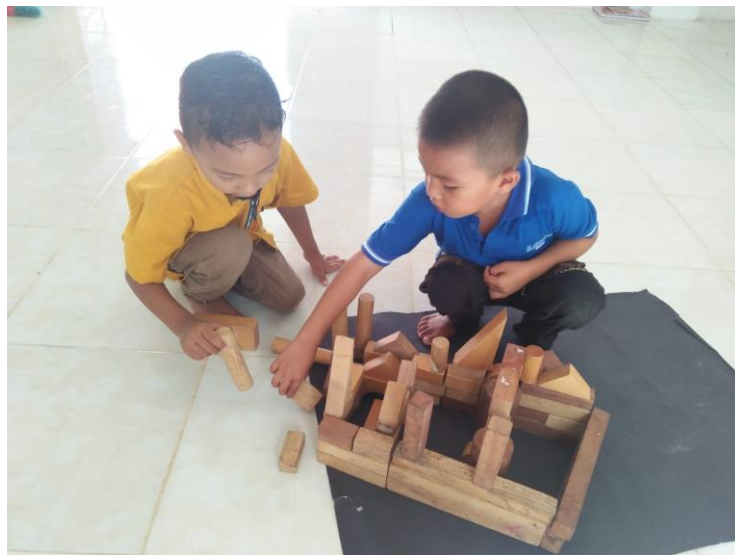
Gambar 2. Kegiatan Pembelajaran di kelas Quba' RA Darul Falah (Dokumentasi: Jumaiyah, 25 Agustus 2020, pukul 10.15 WIB)

Berkaitan dengan gambar di atas dan kesepakatan belajar sistem bergilir didasari pula atas penetapan zona merah dan hijau atas penyebaran virus corona (covid-19) yang berpengaruh terhadap kesiapan pembelajaran yang diterapkan oleh pihak lembaga pendidikan. Seperti halnya TK/RA di Kabupaten Aceh Tenggara, pelaksanaan pembelajaran tatap muka dengan sistem bergilir dilaksanakan atas dasar lingkungan (daerah) yang tergolong aman. Hal ini selaras dengan pernyataan Juli ketika diwawancarai berikut ini: