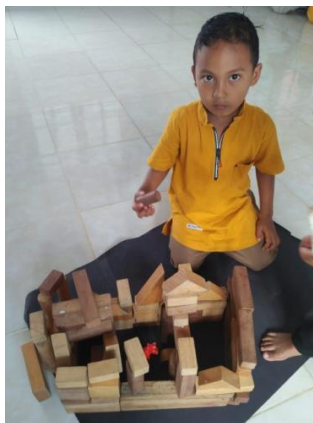
Gambar 3. Hasil Rumah yang telah Berhasil Disusun Siswa. (Dokumentasi: Jumaiyah, S.Pd.I., 25 Agustus 2020)

Berikut ditampilkan gambar siswa yang telah mampu menyusun permainan seperti rumah: