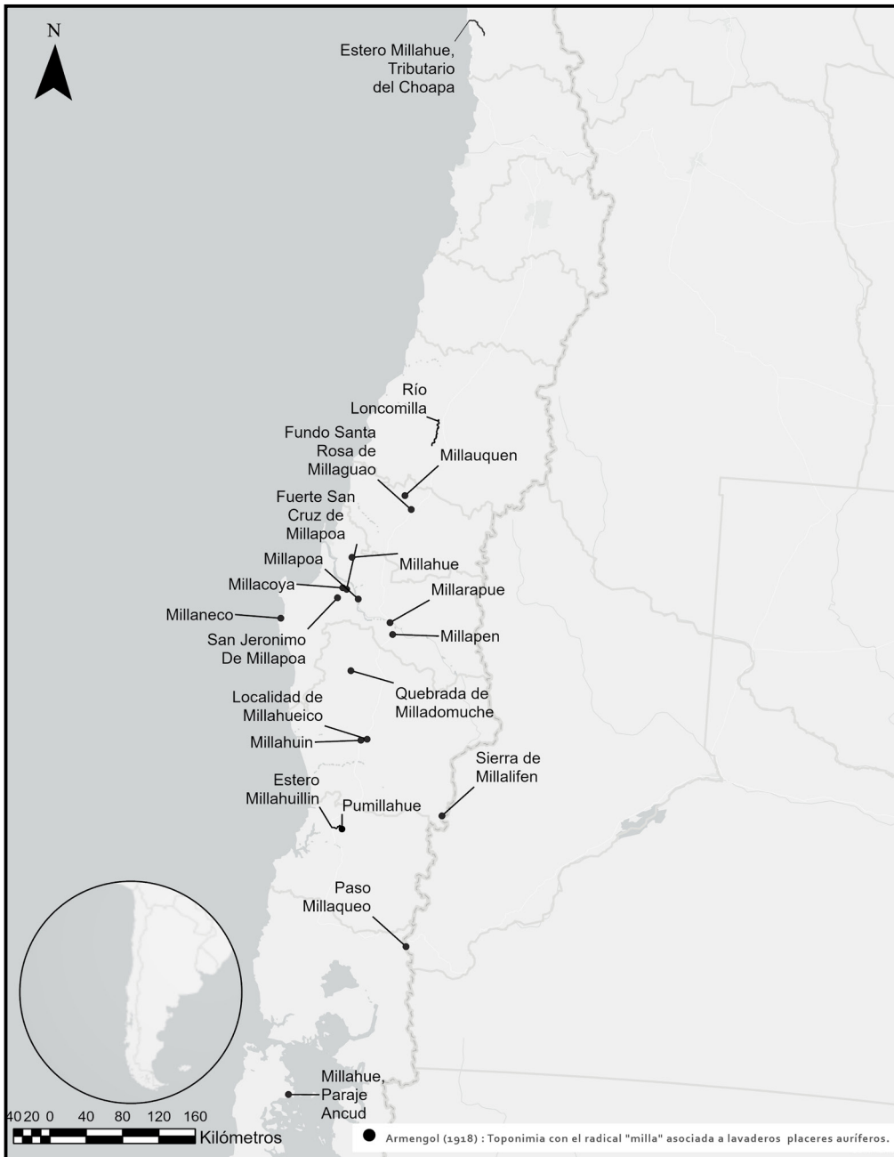
Figura 1. Toponimia con el radical milla asociada a lavaderos y placeres auríferos en el diccionario de Armengol (1918). Elaboración: Rodrigo Mendoza.