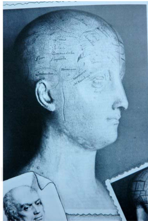
Figura 2. Nomenclatura de las protuberancias craneales del lado derecho acuñada por Gall a finales del siglo XVIII.

En su trabajo “La selección de los generadores Humanos”, Saavedra señala que el Estado debe, a través de las autoridades