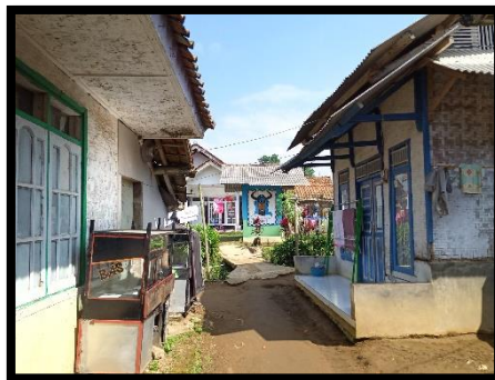
Gambar 1 Pemukiman warga masyarakat Saungjaya

Masyarakat yang bermukim di Kampung Saungjaya mayoritas masyarakat tradisional yang merupakan orang Sunda asli yang memakai tradisi Sunda. Kehidupan masyarakat pun yang masih mengandalkan hasil pertanian, bahkan bahan anyaman yakni bambu pun didapat dari gunung. Bambu yang dipakai oleh masyarakat Saungjaya untuk menganyam bukanlah bambu sembarangan ataupun bambu yang berada di kampung-kampung lainnya. Akan tetapi, bambu gunung yang didapatkan dari pegunungan ( awi tali ), dan dianyam oleh para istri yang tidak ada pekerjaan dirumahnya. Peneliti melihat hal ini dari aktivitas masyarakat yang menganyam di dekat rumah-rumah mereka untuk dipasarkan bahkan ada yang mengajarkan kepada anak-anak agar budaya menganyam dapat terwaris secara turun temurun.