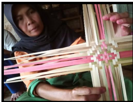
Gambar 5 Proses Pembuatan Pihuntu

Setelah bambu dipotong menjadi 25 sira tidak langsung dijadikan 8 swakan . Akan tetapi, bagian paling dalam ( hate awi ) dihilangkan dengan cara diraut. Cara menentukan ukuran lebar lembaran bambu yang digunakan untuk menganyam nyiru mereka menggunakan ukuran swakan nyiru . Karena setiap bambu mempunyai ketebalan yang berbeda-beda sehingga setelah menjadi bagian ( sira ) mereka meraut dengan 1 kali rautan (terlihat setara dengan 1 cm). Potongan tersebut dipisahkan antara kulit ( hinis ) dan isinya ( sasira = 1 hinis dan 7 daging bambu). Kedua , yakni membuat pihuntu . Pihuntu merupakan patokan atau dasar suatu anyaman. Pihuntu ini dianyam dari bambu yang berbeda dengan anyaman selanjutnya, bambu yang digunakan adalah kulit bambu ( hinis ) yang sudah dipotong tipis dan diraut. Pihuntu ini menggunakan 6 helai kulit bambu ( hinis ) yang dibagi 2 untuk disimpan tepat memotong satu sama lain (saling tegak lurus). Pola anyaman pihuntu , dengan 3 helai hinis vertikal yang memotong 3 helai hinis horizontal, yaitu 3 1 3 1, 3 rungkup (ke atas), 1 rungkup (ke atas), 3 sodok (ke bawah) dan 1 sodok (kebawah).