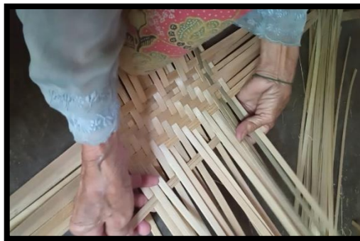
Gambar 4 Penganyam melakukan aktivitas menganyam

Seorang penganyam tentunya Ibu Dodoh tidak sendiri mempersiapkan bahan-bahan anyamannya, melainkan disana terdapat juga Bapak Solihin yang sedang menipiskan bambu yang akan dijemur. Bambu yang ditipiskannya dipisahkan antara kulit bambu dan isi batang bambu.