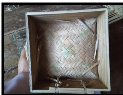
Gambar 8 Soko pada boboko

(g) Soko , yaitu membentuk penyangga alas boboko , dengan bambu yang dipipihkan dengan ukuran sesuai dengan jenis boboko . Caranya, pengrajin mengukur bambu yang dipipihkan ke anyaman yang telah selesai dibuat, setelah itu mengukur lagi ukuran bambu yang sudah ada ke bambu yang lain. Melakukan seperti itu, sampai 5 sisi terbentuk. Dengan ukuran sisi pertama dan terakhir, diongklangan (dikurangi) 2 ramo . Inilah alasannya kenapa dibentuk 5 sisi, karena ada 2 sisi yang dikurangi dan akan dijadikan sebagai 1 sisi.