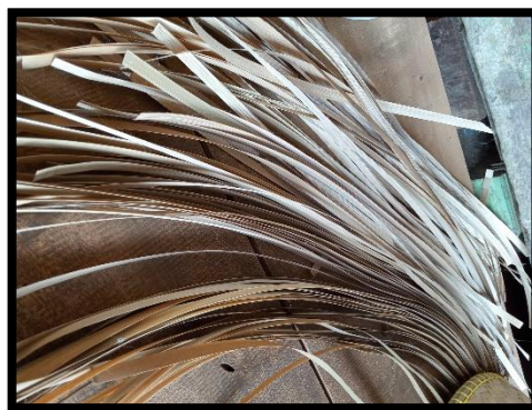
Gambar 2 Bahan Anyaman

Observasi ini dilakukan pada pembuatan pola anyaman yang berkaitan dengan aktivitas menganyam. Pada observasi ini peneliti berkesempatan untuk dapat melihat secara langsung aktivitas menganyam yang dilakukan masyarakat di Kampung Saungjaya. Saat itu Ibu Dodoh sebagai penganyam sedang merangkai anyaman yang terbuat dari bambu. Di sampingnya terdapat beberapa persediaan bahan-bahan untuk dirangkaikan. Bambu tersebut sudah potong dan disapuh menjadi sangat tipis kira-kira memiliki ukuran lebar 1 cm dan panjang 70 cm.