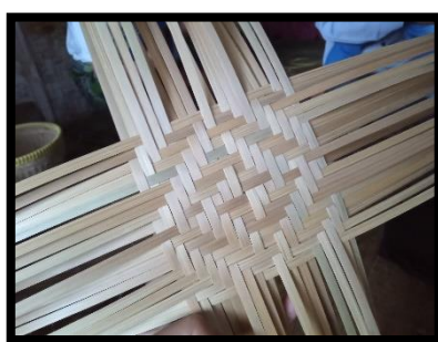
Gambar 6 Rangkaian Babatok