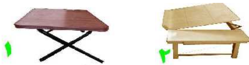
شکل ۱- میزهای لپ تاپ پُر فروش موجود در بازار