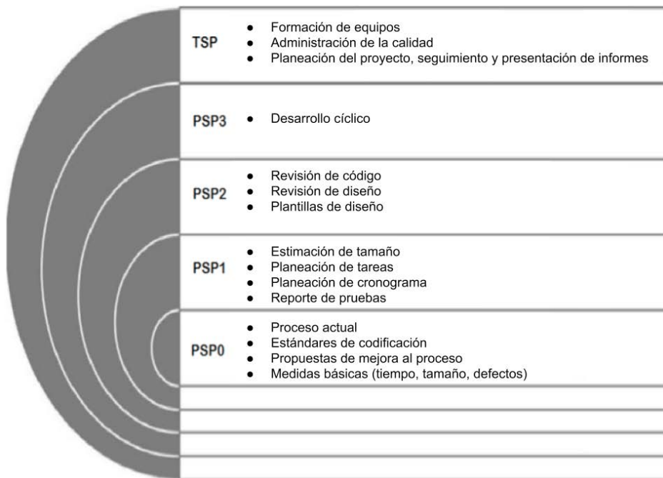
Figura 2. Procesos y objetivos del PSP

prácticas de procesos software , tradicionalmente consideradas como una estrategia metodológica orientada hacia el aseguramiento de la calidad de productos de software a partir del abordaje e intervención en procesos de desarrollo. La idea de las certificaciones es que los profesionales puedan ofrecer mejora continua y competitividad en las empresas de la industria de la tecnología, con el objetivo de que puedan implementar procesos adecuados para poder generar productos de alto nivel [14]. Sin embargo, cabe resaltar que el Mintic no proporciona espacios ni apoyos en los entornos laborales de los desarrolladores para realizar seguimiento o iniciar pilotos PSP, por lo cual, la aplicación de estos cursos oficiales patrocinados por el Mintic en entornos reales, es directamente dependiente al apoyo que reciban los desarrolladores formados en PSP por parte de las empresas a las que pertenecen.