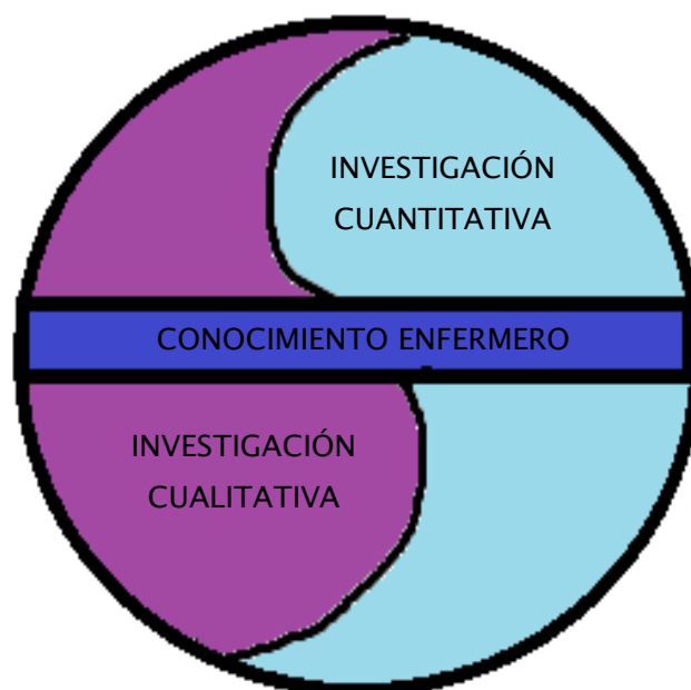
Figura N° 01. Complementariedad existente entre la investigación cuantitativa y cualitativa para generar tipos de conocimiento

Fuente: Soledad Gómez 9 Realizado por: la Investigadora