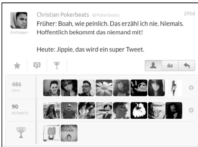
Abbildung 2: Tweet von @Pokerbeats vom 29. Mai 2013, Screenshot von Favstars Web-Interface

@Pokerbeats beschreibt eine Umcodierung peinlicher Erlebnisse: Vor seiner Twitter-Initiation gab es Geheimnisse, die man vor anderen zu bewahren und derer man sich zu schämen hatte. Twitter verkehrt dieses Erlebnis ins Gegenteil