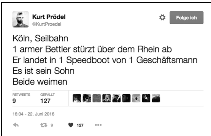
Abbildung 3: Tweet von @KurtProedel vom 22. Juni 2016, Screenshot Twitters Web-Interface

Zunächst einmal liegt hier eine auf ein narratives Skelett 32 reduzierte Erzählung eines maximal unwahrscheinlichen Ereignisses vor: Ein Bettler fährt mit der Kölner Zoo-Seilbahn über den Rhein und stürzt dabei ab. Dabei fällt er zufällig in ein über den Rhein fahrendes Speedboot. Der Fahrer ist ein Geschäftsmann, der sich als sein Sohn herausstellt. Als sie dies bemerken, weinen sie. Der Plot ist also eine unwahrscheinliche Vater-Sohn-Zusammenführung; man könnte sogar sagen, dass dies die spiegelverkehrte Version des Gleichnisses vom verlorenen Sohn ist: Der Sohn kehrt nicht arm zum Vater zurück, sondern der verarmte Vater fällt arm dem reich gewordenen Sohn zu. Dies ist natürlich eine Formel populären Erzählens, die sich @KurtProedel zu eigen macht und in ein lokales Setting platziert. Das scheint mir hier entscheidend zu sein: Es handelt sich bei der Spiegelverkehrung nicht um eine Art mundus inversus des biblischen Gleichnisses, sondern um die Kreuzung dieser einen populären Erzählstruktur mit einer zweiten: derjenigen des American dream und seiner Dialektik von Armut und Reichtum. Es wird also nicht nur eine Unwahrscheinlichkeit auf die nächste gestapelt (es reicht nicht, dass der Bettler aus der Seilbahn in ein Boot fällt, sondern es muss ein Speedboot sein, in das der Fall allein schon der Geschwindigkeit wegen noch unwahrscheinlicher wäre), sondern der Tweet bastardisiert auch populäre Erzählschemata, sodass er gewissermaßen unter dem Ge-