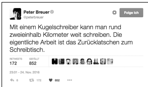
Abbildung 1: Tweet von @PeterBreuer vom 24. November 2016, Screenshot aus Twitters Web-Interface

legt war, so etwa hier durch einen Spaziergang im Wald, nach dem man heimkehrt. Ein anderer solcher Fall war @goganzeli, die mir von Situationen in verschiedenen Räumen ihrer Wohnung berichtete, die gegeneinander einen Kontrast bildeten. Selbstaussagen der Autoren sind hier insofern Quellen von begrenztem Wert, die erst im Verbund mit anderen Quellen, wie der Introspektion, dem close reading anderer Tweets oder den Netzwerkanalysen der Digital Methods Validität gewinnen. Diese Begrenzung gilt – wenn auch in anderer Weise – auch für die eigenen Aufzeichnungen: Die Tweets, in deren Entstehung bereits eine narrative Struktur angelegt ist, erinnert man besser und man fühlt sich auch leichter motiviert, dies im Feldtagebuch zu dokumentieren.