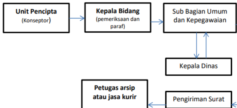
Gambar 2 Alur Surat Keluar

Proses selanjutnya yaitu pengelolaan surat keluar pada Dinas Perpustakaan dan Kearsipan Kota Bandung dalam penciptaannya dapat dibuat di sub bidang masing-masing. Pencipta arsip tersebut bertanggungjawab menetapkan klasifikasi arsip berdasarkan pedoman penyusunan klasifikasi arsip Peraturan Wali Kota Bandung Nomor 71 Tahun 2020 Tentang Klasifikasi Arsip dan juga sesuai dengan Peraturan Wali Kota Bandung Nomor 36 Tahun 2021 tentang Naskah Dinas di Lingkungan Pemerintahan Kota Bandung. Proses yang dilakukan yaitu membuat konsep surat, pengetikan surat, memeriksa surat, mencatat surat ke Buku agenda keluar, kemudian menyerahkan ke pimpinan untuk di tanda-tangani dan didisposisi sesuai dengan tujuan surat tersebut, serta mendistribusikan surat. Lalu untuk penomorannya nanti disesuaikan dengan menggunakan kode klasifikasi. Ketika membuat konsep surat, pengetikan surat, selanjutnya diperiksa kembali apakah sudah sesuai dengan pedoman yang berlaku. Kemudian menyerahkan ke pimpinan untuk di tanda-tangani dan dibuat sebanyak 3 eksemplar. Lembar pertama yang asli disimpan di Sub Bagian Umum dan Kepegawaian, lembar kedua salinan untuk pencipta, dan lembar terakhir untuk di disposisi sesuai dengan tujuan surat tersebut.