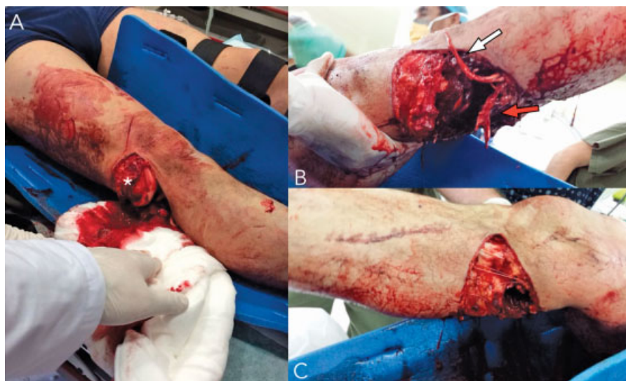
Fig. 1 Hombre, 42 años. Sufre atrapamiento de ambas extremidades inferiores entre ascensor y estructura metálica. Ingres a Servicio de Urgencia con luxación expuesta de la rodilla derecha. La exposición del cóndilo femoral lateral (*) evidencia la persistencia de la pérdida de congruencia articular (A). Al realizar la exploración quirúrgica se evidencia la extensión de la exposición desde lateral (A) hasta medial (C) comprometiendo toda la región posterior (B), asociada a lesión completa de la arteria poplítea (flecha blanca) y nervio tibial (flecha roja).

Una vez estabilizados los pacientes fueron sometidos a cirugía de reconstrucción ligamentaria de acuerdo a la clasificación de la lesión; a las 2 semanas reconstrucción