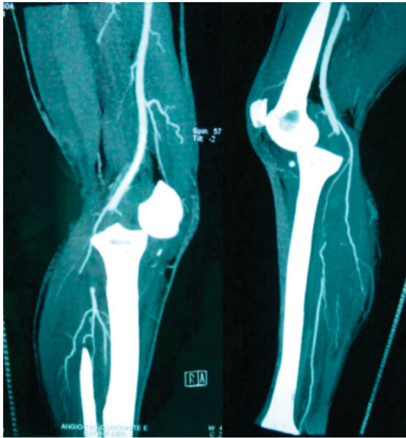
Fig. 3 AngioCT de extremidades inferiores que evidencia incongruencia articular fémoro tibial e interrupción del flujo arterial a nivel poplíteo.

El compromiso del nervio peroneo común (NPC) es un factor de mal pronóstico en contexto de luxación de rodilla. 7,12 Diversas publicaciones describen compromiso del NPC entre el 5% y el 20% de las luxaciones cerradas de rodilla; Owens y col., en el año 2007, publicó una serie de 28 luxaciones de rodilla y lesión del NPC en el 75% de esos casos. 10 Los escasos reportes de series que agrupan solo luxaciones expuestas, describen presencia de esa lesión hasta en un 37% de los casos. 10,12,20,21 Esa lesión presenta grados significativos de recuperación en series de luxaciones cerradas de rodilla. 7 No encontramos información relativa a ese punto en luxaciones expuestas. 10 La serie quirúrgica presentada duplica las cifras reportadas en otros estudios llegando al 63,6% de los casos con lesión neurológica; esa alta incidencia puede al igual que en el caso de lesiones vasculares, atribuirse a la alta energía involucrada que determina desplazamientos óseo significativos y en forma secundaria tracción de estructuras neurovasculares. 1,12,20,22