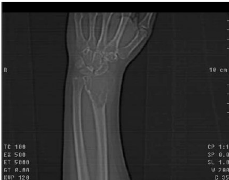
Figura 2. Tomografía axial computarizada de la muñeca.