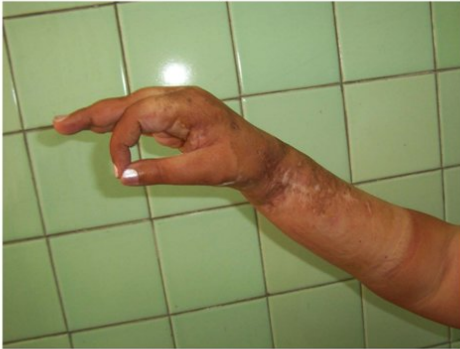
Figura 4. Recuperación: la función del miembro es aceptable.

No se aplicó quimioterapia ni radioterapia.