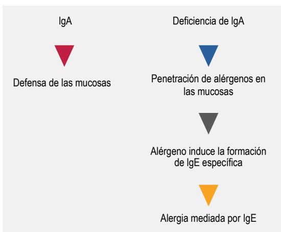
Figura 2. La falta de defensa de las mucosas por la IgA permite mayor penetración de los alérgenos, lo cual induce la formación de IgE específica contra el propio alérgeno. El resultado es la mayor prevalencia de alergias mediadas por IgE en portadores de deficiencia de IgA.

Al analizar por separado las deficiencias parcial y total de IgA fue posible apreciar que los pacientes con deficiencia total presentaron en forma significativa mayor número de episodios de enfermedades infecciosas como rinosinusitis, amigdalitis y conjuntivitis, lo cual se explica por la falta de protección contra patógenos presentes en las mucosas de las vías aéreas superiores, donde habitualmente se secreta la IgA. Algunos estudios han mostrado que la deficiencia total de IgA puede propiciar giardiasis, meningoencefalitis vírica y, con menos frecuencia, neumonía. 9,10 Los pacientes con deficiencia total pueden manifestar aún mayor susceptibilidad a infecciones víricas (principalmente por enterovirus y parainfluenza) e infecciones bacterianas. 19