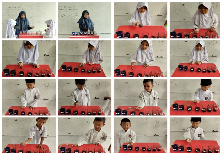
Gambar 2. Guru mendemonstrasikan, kemudian anak mempraktikkan yang guru contohkan.

memukul gelas yang sudah diisi air dengan kadar yang berbeda menggunakan sendok. Setelah siswa memukul gelas yang berisi air dengan sendok tadi, kemudian siswa membedakan bunyi yang dihasilkan dari tiap-tiap gelas yang berisi air dengan takaran yang berbeda. Setelah siswa selesai mempraktikkan, guru meminta siswa untuk mengisi soal yang sudah ada di lembar LKS, setelah itu guru memberi penjelasan mengenai praktikum yang sudah dilakukan siswa tentang tinggi rendah nada. Pelaksanaan demonstrasi dan pengisian lembar LKS dapat dilihat pada gambar 2 dan 3.