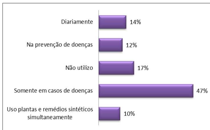
Figura 2 - Frequência da utilização de plantas medicinais.