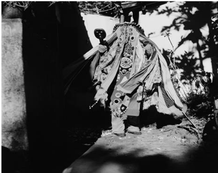
Figura 02: Babá Alapalá no Omo Ilê Agboulá, no Barro Vermelho

Egum africanos que foram preservados, para fornecer conselhos, orientações, caminhos para os vivos, os seus descendentes em seu fluxo de vida, em seus problemas cotidianos, eventuais, específicos de cada um ou de toda a sociedade.