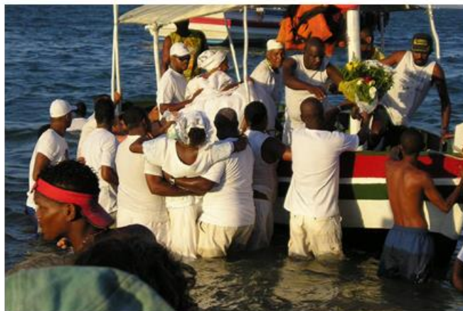
Fig. 10: Os membros da sociedade de culto a ancestralidade embarcam para levarem os presentes a Iemanjá.

Data: 02/02/2007.