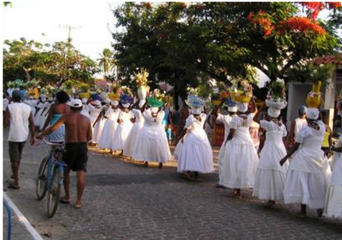
Fig. 09: O cortejo, depois de saudar os mais velhos vai em direção a praia

Data: 02/02/2007.