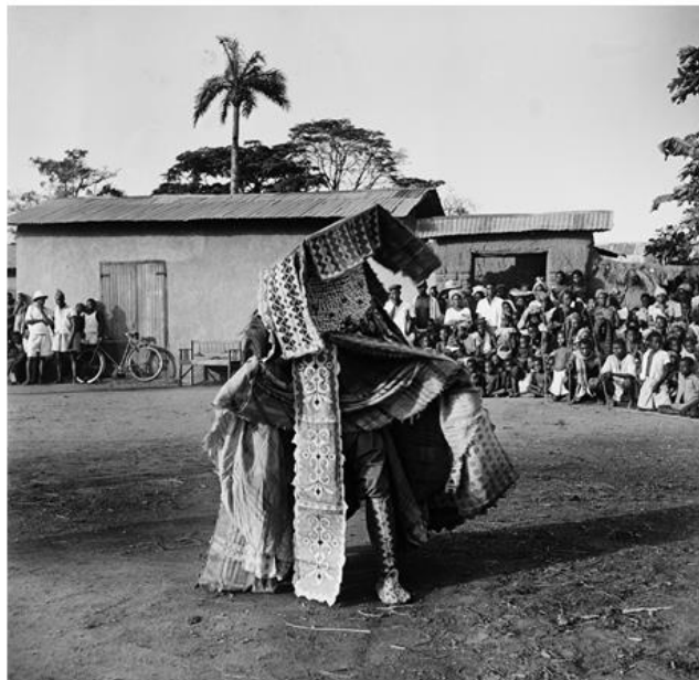
Figura 01: Um Egúngún pelas ruas da cidade de Quidah, no Benim.