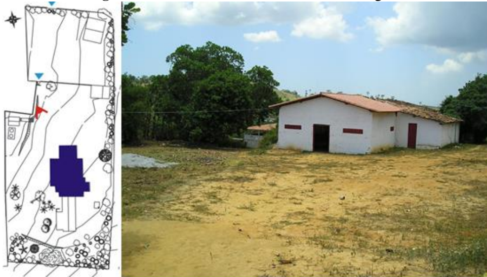
Figura 04: Vista do Barracão do Omo Ilê Agboulá

Data: 08/02/2006.