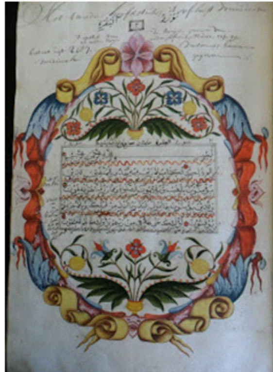
Gambar 10. Foto. Mushaf Alquran dari Pulau Manipa, Koleksi Universitas Leiden.

Dalam catatan sejarah, Luhu adalah kota pelabuhan dari Kerajaan Hoamoal. Kejayaan Kerajaan Luhu (Hoamual) mengalami keruntuhan akibat kekerasan Bangsa Belanda yang ingin monopoli hasil cengkeh di Kerajaan (Hoamual) selama kurang lebih 31 Tahun, disertai dengan penebangan cengkeh (Ekstirpasi) oleh pasukan Hongitochtenya. Perang yang berlangsung dari tahun 1625-1656 itu dikenal dengan nama perang Hoamual. Perang tersebut berhasil meluluh lantakan sendi-sendi kehidupan Kerajaan Hoamual. Paska perang Hoamual tepatnya mulai tanggal 6 Maret 1656 Belanda melakukan deportasi (pemindahan penduduk secara paksa) yang adalah merupakan sebagian dari politik pecah belah ( Devide et Impera ). Akhirnya, kekuasaan Kerajaan Hoamual yang dulu meliputi 99 desa / dusun, kini hanya tinggal sebuah desa yaitu Desa Luhu dengan 16 dusun bawahannya.