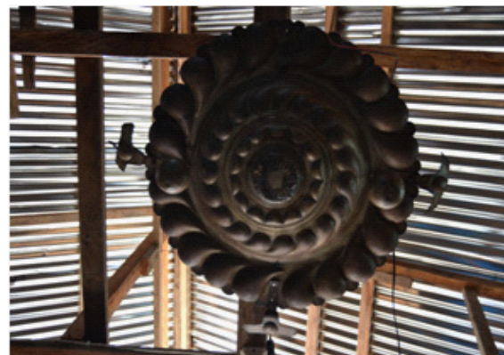
Gambar 2. Foto lampu minyak buatan Portugis, berbahan kuningan, sebagai salah satu alat kelengkapan masjid. Data artefaktual Koleksi Penduduk, meliputi tombak, lampu minyak kelapa, koleksi keramik asing dan gerabah. Tombak

Masjid Luhu, merupakan Masjid Jami Negeri Luhu yang sudah mengalami perombakan, sehingga nyaris tidak ada tanda-tanda kekunoannya. Ciri kunonya diperlihatkan dari empat tiang di tengah ruangan serta bedug masjid yang diletakkan di serambi masjid. Sementara itu, bagian tangga masjid, yang sudah diperbaharui, menurut sumber tutur disebutkan bahwa jumlah 12 anak tangga menyimbolkan 12 marga yang ada di Negeri Luhu. Berdasarkan keterangan masyarakat, masjid pertama kalinya dibangun pada pertengahan abad ke 17 M, setelah utusan Ternate secara resmi memerintah Hoamoal.