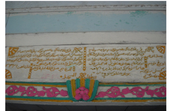
Gambar 8. Foto Prasasti yang tertera di atas pintu masuk Masjid Kuno Manipa

Keempat, data arkeologi di Wilayah Pulau Manipa. Dalam tinjauan singkat di Pulau Manipa, tepatnya di desa Tumeluhu, terdapat masjid kuno yang kemungkinan dibangun pada awal abad ke 19 M.