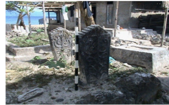
Gambar 7. Foto Salah satu bentuk makam kuno tipe Ternate, yang diduga sebagai makam penyebar Islam utusan Sultan Ternate

Ketiga, Situs Pulau Buano, temuan arkeologi Islam yang penting adalah alquran Kuno dan makam kuno. Alquran kuno dibawa oleh marga Husemahu, difungsikan pada hari ramadhan, dibawa ke masjid di simpan di rumah adat Husemahu. Alquran ini terbuat dari sejenis kertas dengan tingkat kekerasan serat kertas yang tinggi. Di beberapa bagian kertas yang rusak, menunjukkan adanya serat kertas yang cukup kuat. Kemungkinan kertas ini produk luar, hanya saja, tidak ada tanda-tanda logo tertentu yang tertera pada kertas ketika diterawang di sinar matahari secara langsung. Dari gaya tulisannya, tampak sekali alquran ini dihasilkan dari tulisan tangan. Adanya alquran kuno bisa menjadi bukti bahwa pengaruh Islam sudah sangat kuat di daerah itu. Alquran kuno salah satu fungsinya kemungkinan sebagai medium untuk sosialisasi ajaran Islam di daerah itu, baik masa awal maupun masa perkembangan Islam di wilayah itu (Tim Penelitian, 2009: 10).