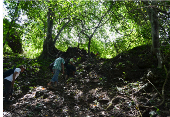
Gambar 1. Foto Situs Batu Kapal sebagai wilayah pemukiman dan benteng pertahanan tradisional Kerajaan Hoamoal pada abad ke 17 M.

Sementara itu gerabah dalam jumlah yang lebih sedikit juga ditemukan di areal tersebut. Hasil analisis morfologi fragmen gerabah yang ditemukan, menunjukkan temuan didominasi oleh gerabah sebagai peralatan sehari-hari. Tampaknya situs ini selain sebagai situs benteng pertahanan, juga dimanfaatkan sebagai hunian, mungkin oleh para tentara atau prajurit kerajaan pada masa perang melawan VOC. Tampaknya hunian, hanya berlangsung pada masa perang mempertahankan Luhu dari serangan VOC pada masa abad ke 17 M. (Tim Penelitian, 2012: 36).