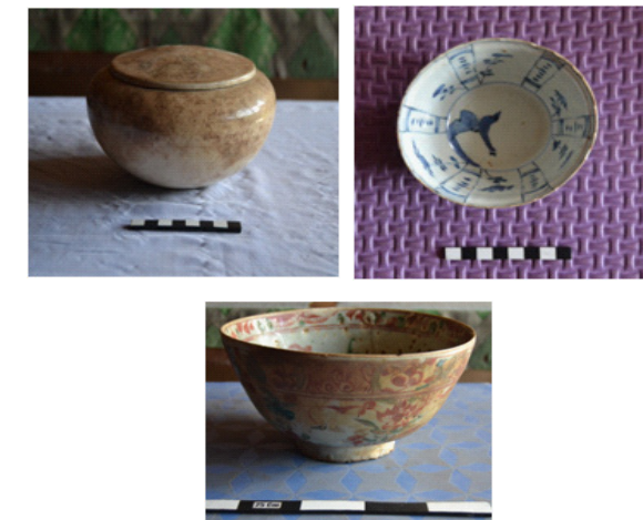
Gambar 3, 4, dan 5. Foto berbagai bentuk keramik asing yang menjadi koleksi penduduk di Negeri Luhu, wilayah bekas pusat Kerajaan Hoamoal

Temuan keramik, beberapa diantaranya menjadi koleksi penduduk, selain temuan dalam bentuk pecahan yang ditemukan di permukaan tanah pada situs-situs yang di survey. Temuan keramik, koleksi penduduk merupakan wadah yang dipergunakan sehari-hari antara lain jenis mangkuk besar, mangkuk kecil dan piring serta cawan. Warna glasir pada umumnya putih kebiru-biruan. Warna bahan putih keabu-abuan, dengan motif hias flora berwarna biru. Jenis keramik ini berasal dari China, kemungkinan dari masa Dinasti Ming (Abad 16-17) dan Qing (17-19 M).