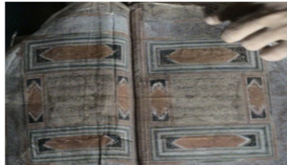
Gambar 6. Foto Koleksi Mushaf Alquran Kuno, Koleksi marga Husemahu di Pulau Buano

tempayan tanah liat, menunjukkan bahwa batu meja tersebut masih dimanfaatkan penduduk sampai sekarang sebagai sarana upacara ritual. Hubungannya dengan batu meja yang berasosiasi dengan makam kuno Islam, serta adanya konteks tradisi atau ritual yang berlanjut, bisa disimpulkan bahwa tradisi megalithik masih berlangsung terus sejak masa awal pengaruh Islam hingga saat ini.