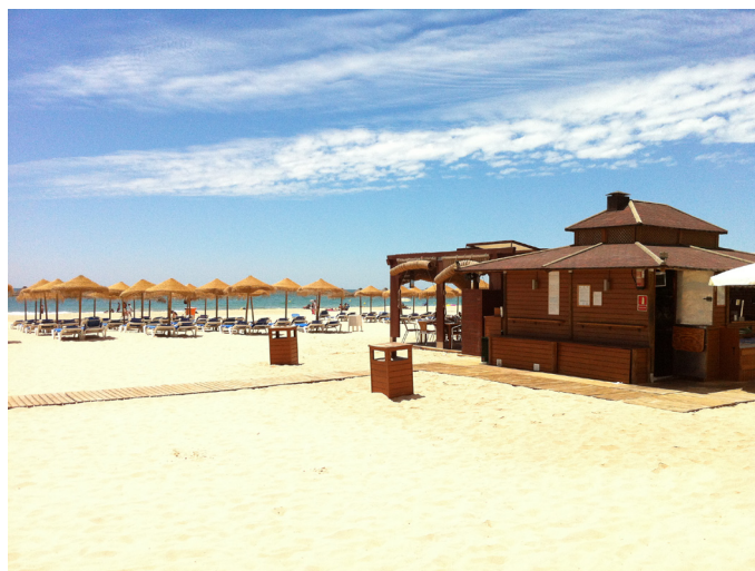
Figura 3. Bar na Praia Victoria no município de Cádiz, Espanha Figure 3. Beach bar – Victoria Beach in Cádiz, Spain

A Lei determina ainda que os municípios devem, antes do início da temporada, apresentar ao órgão competente pela gestão das praias (instituição similar à SPU no Brasil) um plano de praia . Este documento tem como objetivo favorecer a pluralidade de usos nas praias, priorizar os usos na área de domínio público marítimo terrestre, salvaguardar os valores dos bens de domínio público marítimo terrestre, conservar os espaços protegidos legalmente, garantir o acesso às praias, ordenar o uso da lâmina de água e potencializar a gestão integrada das praias (Jefatura del Estado/Espanha, 1988). O Plano de Praia deve conter todas as instalações que o município considera importante para os serviços de praias, definindo como e quando será feita a seleção pública daqueles que forneceram estes serviços. São permitidas estruturas móveis na faixa de areia, mas sempre quando e se planejadas anteriormente e devidamente autorizadas pelo órgão competente. Já no Brasil, este plano de uso das praias, nos meses de maior afluxo de pessoas, não existe como instrumento legal. Neste caso, o Projeto Orla poderia vir a