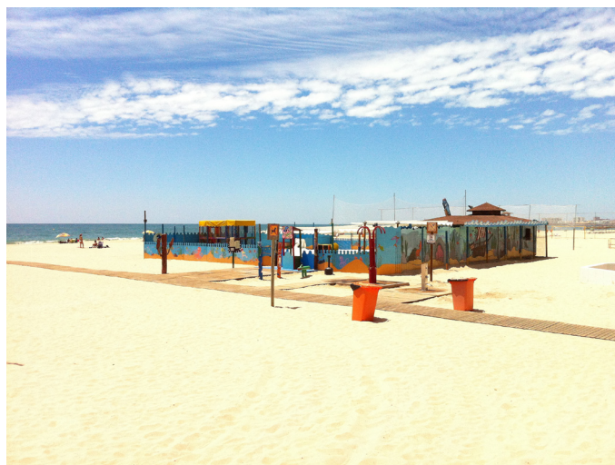
Figura 4. Área de recreação para crianças. Figure 4. Childcare area.