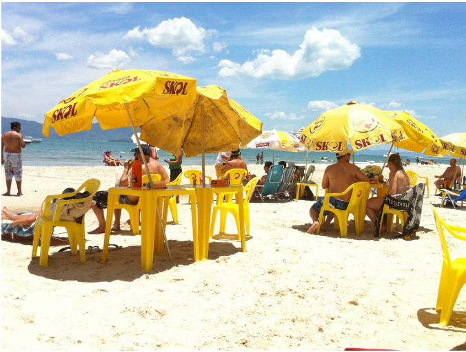
Figura 5. Mesas e guarda-sóis com propaganda em praia de Florianópolis, SC

Figure 5. Tables and chairs with publicity in Florianópolis, SC